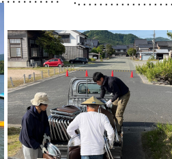
朝早くから椅子を運ぶ振興部の方々