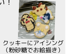
クッキーにアイシング (粉砂糖でお絵描き)

中学生は地元が好きの子が多く、地域のために何かしたいと声をかけてくれました。自治会ではそんな中学生ともっと交流し、コラボできたらいいなと考えています。パーティの飾り付けや演出を手伝ってくれた地域の方もありがとうございました。