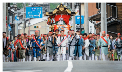
①秋祭り継承プロジェクト