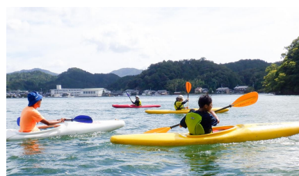
④久美浜湾水質調査改善プロジェクト