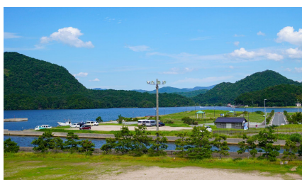
③子育て環境整備プロジェクト