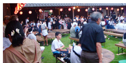
↑↓以前の七夕まつり